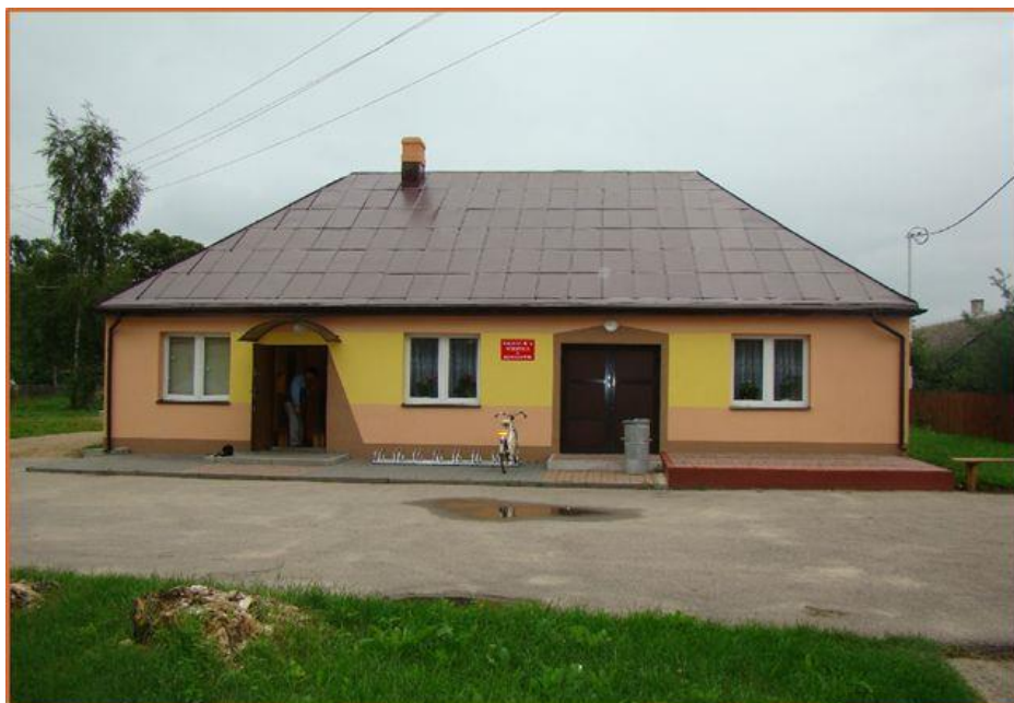
Świetlica Wiejska w Kuraszewie

Odbývają się tam min. „Jesienne Spotkania z folklorem”, w których to czynny udział bierze zespół śpiewaczy „Niezapudki” z Kuraszewa. Zespół ten otrzymał za swoje zasługi w krzewieniu i pielęgnowaniu miejscowej kultury odznakę „Zasłużony Działacz Kultury”.