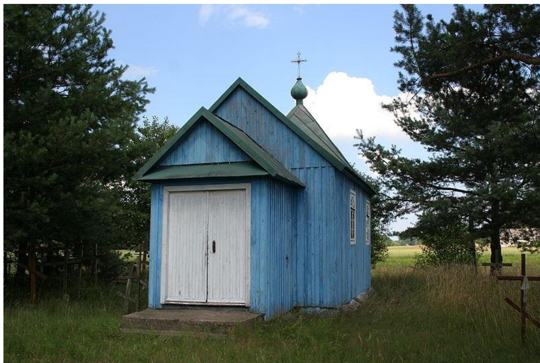
Kapliczka pw. św. Braci Machabeuszów w Ladach

Ze względu na zły stan techniczny otoczenie i ogrodzenie cerkwi p.w. św. Antoniego Pieczerskiego w Kuraszewie wymaga generalnego remontu.