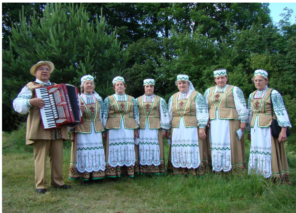
Zespół Śpiewaczy „Niezabudki” z Kuraszewa

Dorobek artystyczny zespołu jest znaczny, stosunkowo bogaty i wszechstronny, a za swoje zasługi w dziedzinie krzewienia i pielęgnowania miejscowej kultury w 1996 roku członkowie zespołu zostali odznaczeni odznakami indywidualnymi „Zasłużony Działacz Kultury”.