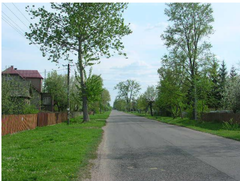
Ulicówka w Kuraszewie